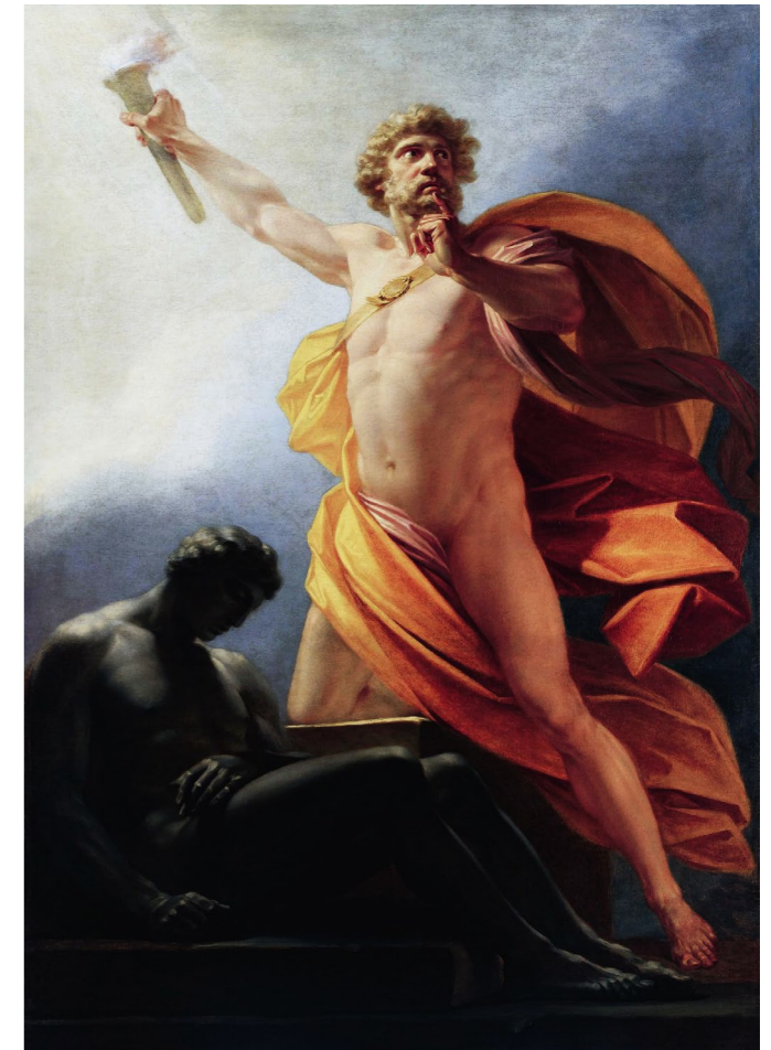
Heinrich Friedrich Füger, Prometheus bringt der Menschheit das Feuer Prometeo porta il fuoco all'umanità, 1817

Redaktion: Sebastiano de Salvo Student der Freien Universität Bozen, 2024