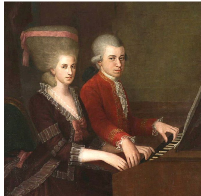
Wolfgang e Nannerl Mozart

Dei ventisette concerti per pianoforte e orchestra di Wolfgang Amadeus Mozart giunti fino ai giorni nostri, venticinque sono per un pianoforte, uno per tre pianoforti e, il numero dieci VIDEOLINK , per due pianoforti. Nonostante non si abbiano prove certe della destinazione di questa composizione, molti musicologi ritengono che il concerto fosse stato concepito per essere eseguito dallo stesso Mozart assieme alla sorella Nannerl, pianista altrettanto capace e brillante.