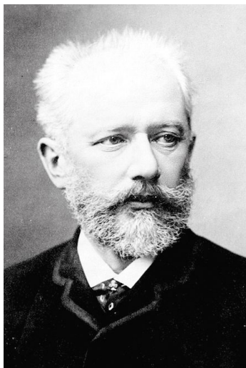
Peter Tchaikovsky (1888)

definitiva solamente intorno al 1889. In realtà, sin dall'esordio del 1875, la critica e il pubblico apprezzarono molto il concerto, sia negli Stati Uniti, sia nelle successive repliche in Europa, decretandone un successo che dura, oramai, da circa centocinquant'anni.